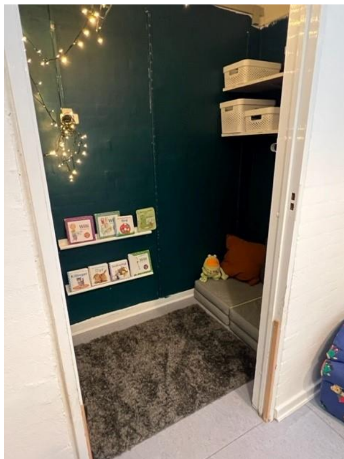
Tid til ro og fordybelse - afskærmet fra den øvrige legezoner på stuen

Vi har arbejdet målrettet med at den voksen som har positionen "Børn" også skaber et pædagogisk indhold for de børn som kan opleve at være i en "venteposition" i micro overgangen. Flere stuer arbejder med en micro-overgangs-kasse/kuffert med udvalgte pædagogiske aktiviteter.