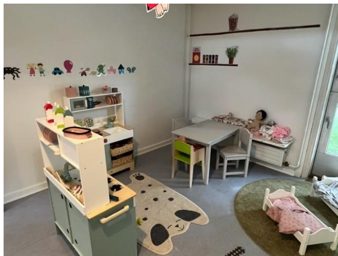
Køkkenleg – vi har på de fleste stuer valgt at læringsmiljøet skal indeholde to køkkener, så vi skaber mulighed for at børnene kan spejle sig i relationen med hinanden omkring det fælles tredje.

Vi har fortsat arbejdet med målrettet at skabe fysiske læringsmiljøer og legezoner, der tydeliggør hvad rummet kan bruges til. Det tydeliggør samtidig hvor i rummet den voksne skal positionere sig og indtage sin rolle i legen; foran, ved siden af eller bagved . Dette har skabt en tydelig ramme for – hvad man som lille barn kan bruge sin vuggestue til. Både medarbejdere og forældre oplever en fordybende ro i hverdagen – og af forældrene primært i afleveringssituationen.